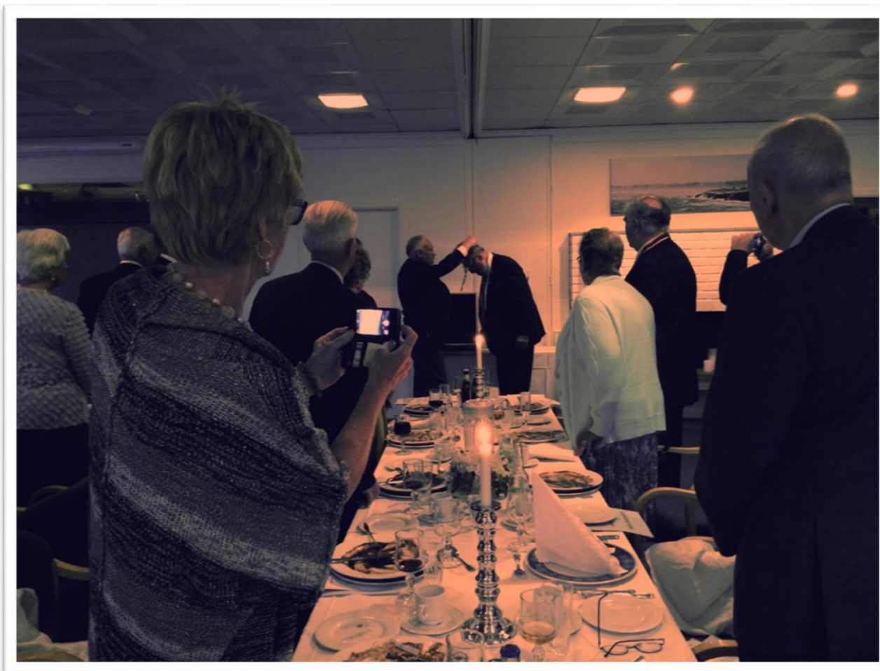
Fra det formelle guvernørskiftet på Aukra hotell lørdag 23. august 2014.

Samme dag hadde de russiske kvinnene besøkt graven og lagt ned blomster, en skikk som Aukra Rotaryklubb har gjennomført i mange år, i forbindelse med 17. maifeiringen. Aukra hotell hadde en russisk kvinne blant sine medarbeidere. Hun er gift med en nordmann og bor på Gossen. Denne kvinnen oversatte det som ble sagt, fram og tilbake mellom de russiske kvinnene og de norske jubileumsgjestene. Det ble en stund fylt av sterke følelser. Det var knapt et tørt øye i salen!