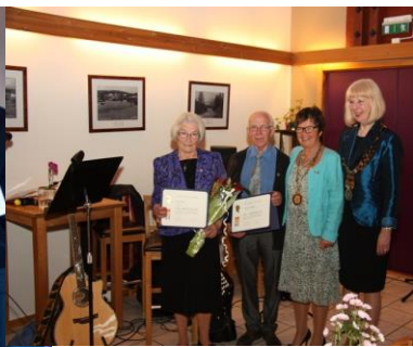
Nord-Odal RK 25 år