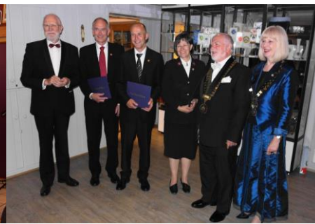
Elverum RK 60 år