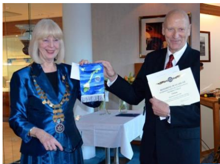
Ulstein RK 50 år

Nord-Odal RK, 25 år (Charterdato 31.05.88)