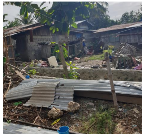
Barna vokser opp i slummen