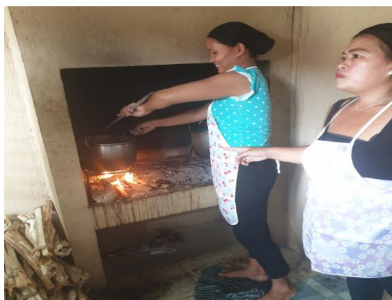
Deilig lunsj tilberedes av mødrene