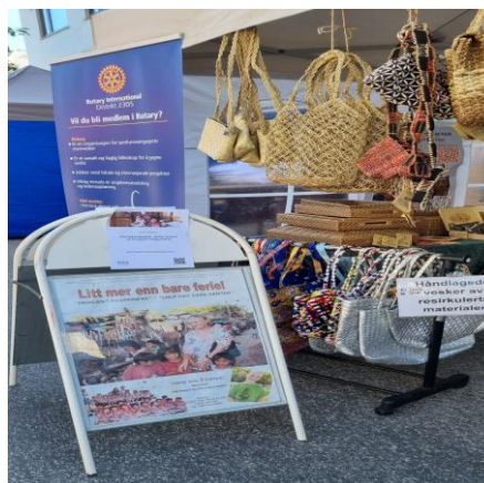
Stand for Prosjekt Filippinene