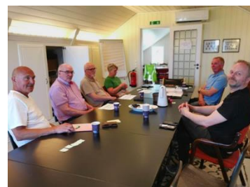
Vestnes Rotaryklubb planlegger neste år.